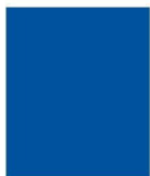
PMS Reflex Blue